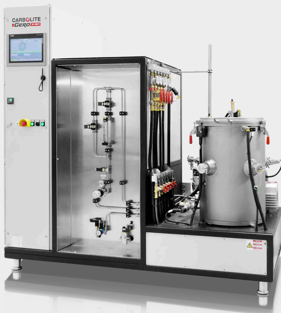
LHTM/W 200-300 Smart