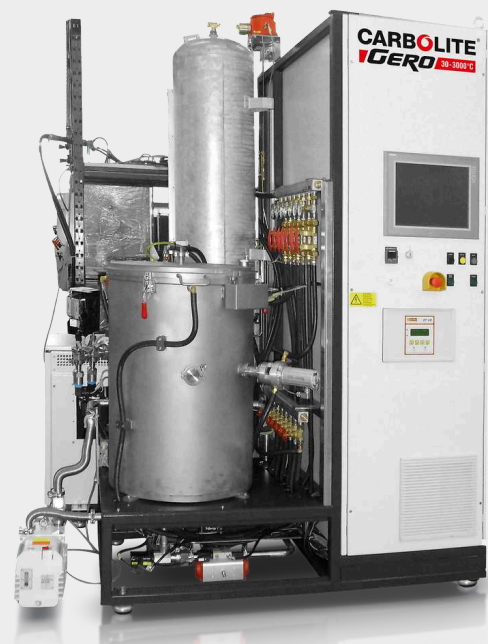
LHTW 200-300/22-1G automatisch bis 2200°C mit optionalem Wasserstoff-Paket