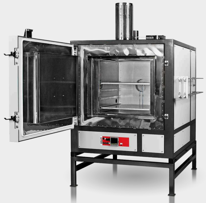
HTMA 6/220 con programmatore nanodac, controllo automatico del gas e opzioni di monitoraggio dell'ossigeno