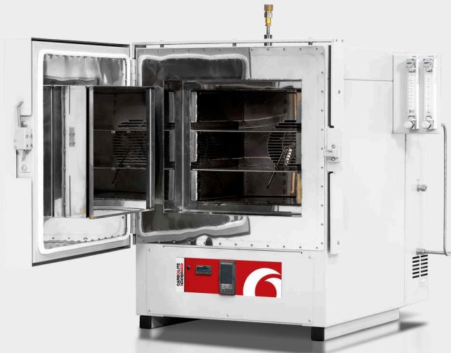
HTMA 6/28 con programmatore 3508P1 e opzioni di controllo automatico del gas