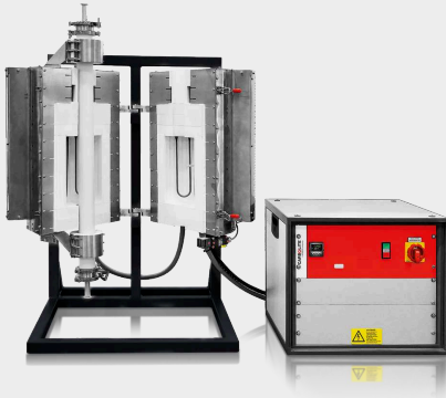
HTRV-A 17/70/250 con soporte y paquete para tubo de trabajo opcionales