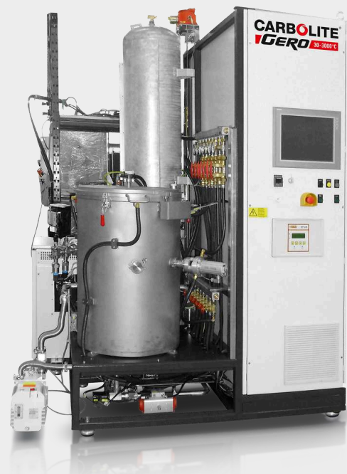
LHTW 200-300/22-1G automatico fino a 2200°C con pacchetto opzionale per idrogeno