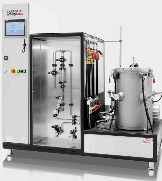
LHTM/W 200-300 Smart