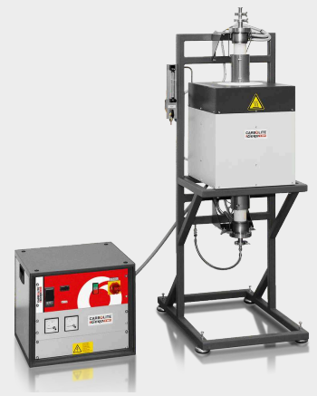
HTRV 18/70/250（オプションで不活性ガスパッケージ、高真空フランジ、E3508P10プログラマー、電流/電圧ディスプレイ付き