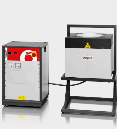
HTRV 17/150/250 Lスタンドオプション付き