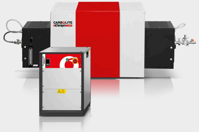
HTRH 17/70/600（オプションで不活性ガスパッケージ、 高真空フランジ、E3508P10プログラマー付き）