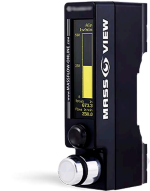
デジタルフローメーターによるガス流量制御