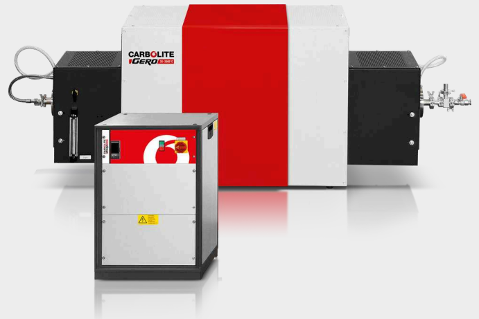
HTRH 17/70/600配有可选惰性气氛环境组件、高真空法兰和E3508P10控制器