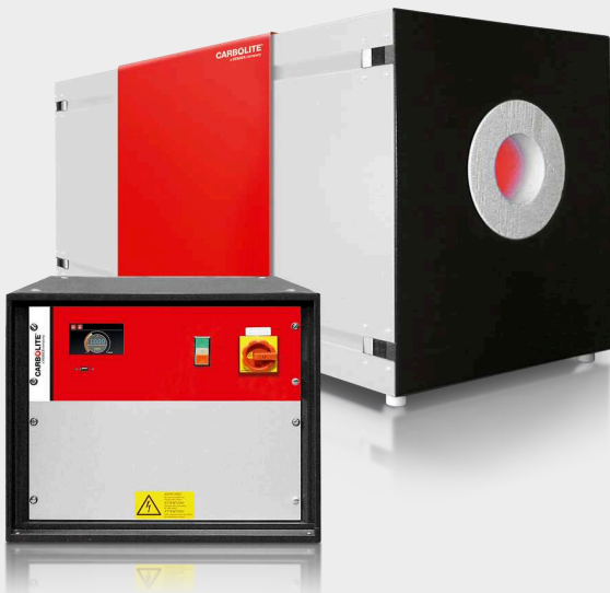
炉体和独立的控制柜