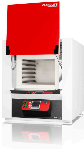
CWF 13/65 with nanodac temperature controller