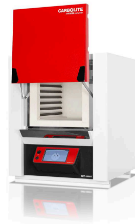
CWF 13/36 with AriesPlus temperature controller