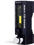
Контроль расхода газа цифровым расходомером