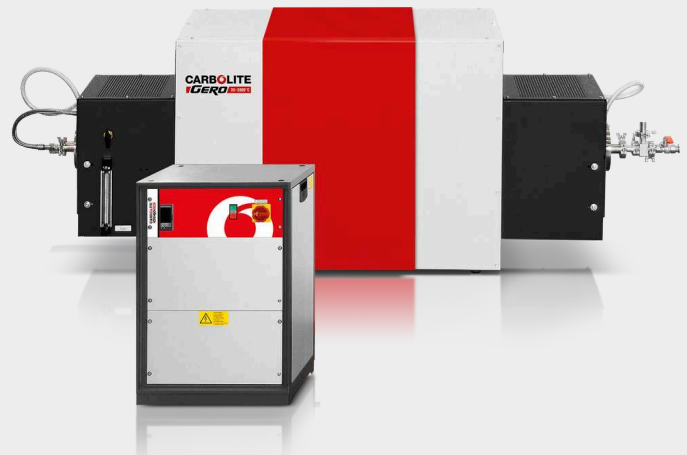
HTRH 17/70/600 cu sistem opțional pentru gaz inert, flanșe de vidare înaltă și programator E3508P10