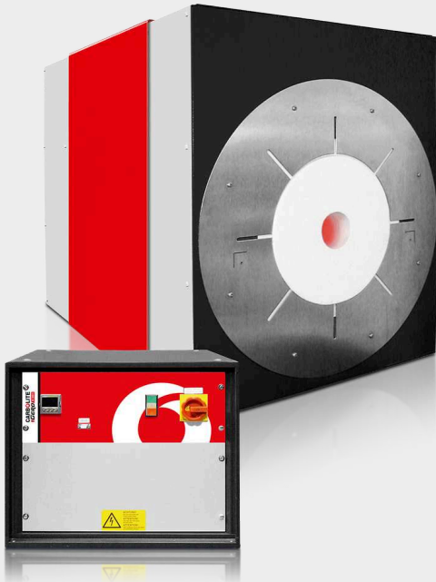
HTRH 18/40/100 cu cutie de control