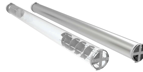
Standardowa rura z kwarcu i opcjonalna rura z metalu

Seria obrotowych pieców rurowych Carbolite TSR może być wyposażona w przyłącza gazowe w celu dostosowania do zastosowań w atmosferze modyfikowanej. Instalacja gazowa jest zabudowana w ramie pieca i wymagane gazy oraz sposób sterowania należy określić w momencie składania zamówienia. Opcje obejmują przepływomierze ręczne lub cyfrowe regulatory masowego przepływu. TSR jest dostępny z różnymi rurami roboczymi. Należy pamiętać, że maksymalna temperatura pracy pieca zależy od właściwości wybranego materiału rury roboczej. Prosimy o kontakt z Carbolite w celu omówienia konkretnych wymagań.