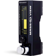
Przepływ gazu sterowany przez cyfrowy przepływomierz