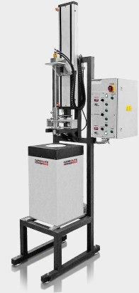
Standardowy piec do hodowli kryształów metodą Bridgmana do 1800°C