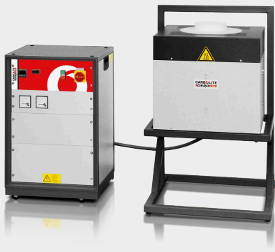
HTRV 17/150/250 s volitelným L- stojanem