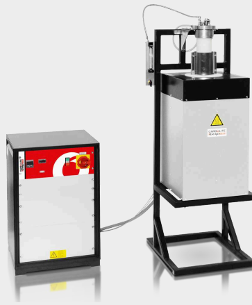
HTRV 18/100/500 s volitelnou výbavou pro použití inertního plynu a s keramickou trubicí, která je uzavřená z jedné strany