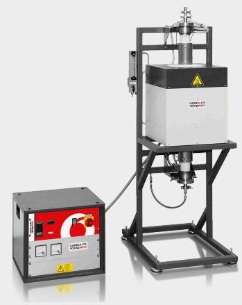
HTRV 18/70/250 s volitelnou výbavou pro použití inertního plynu, vysokotlakovými přírubami, programátorem E3508P10 a displejem "proud/ napětí"

Výhrady k technickému řešení a nedostatkům