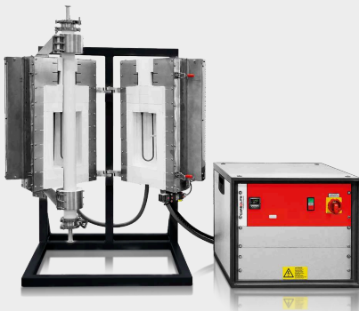
HTRV-A 17/70/250 s volitelným stojanem a volitelnou pracovní trubicou