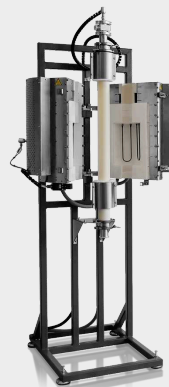
HTRV-A 17/70/250 with inert gas package