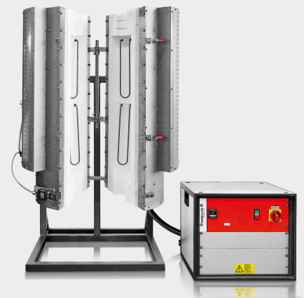
HTRV-A 17/100/700 s volitelným L-stojanem

Výhrady k technickému řešení a nedostatkům