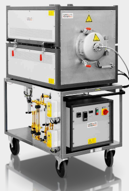
GLO 10 / 11-1G: Kompaktná horkostěnná pec s nerezovou retortou a volitelnou inkonelní retortou (vákuum až 750 ° C a normálny tlak do 1100 ° C)