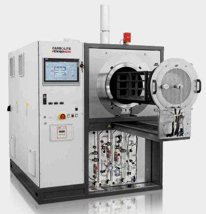
GLO 120/11-1G automatická až do 1100°C s voliteľným súbozem príslušenství pre vodíkové použitie a zasúvacími dverami