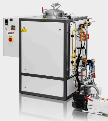
VGLO Carregador Superior 10/11-IG manual até 1100°C com bomba de vácuo opcional (750°C máx.)