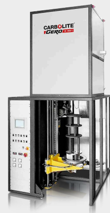
VGLO - versão montada verticalmente do GLO