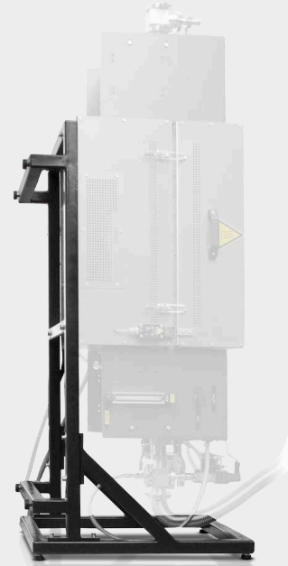
OPÇÃO: SUPORTE VERTICAL