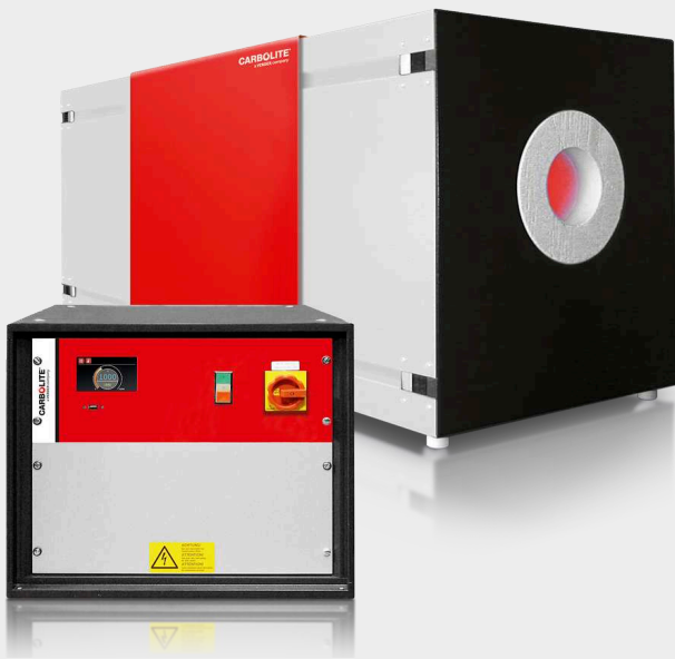
CORPO DO FORNO E CAIXA DE CONTROLE SEPARADA