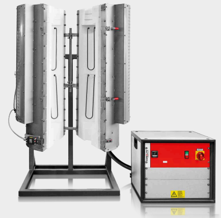
HTRV-A 17/100/700 com suporte opcional