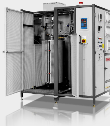
IOR - vasérc redukálhatósági kemence