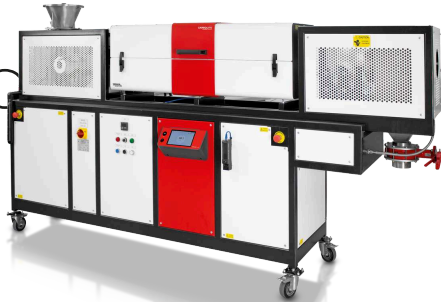
Rotating tube furnace TSR

A Carbolite TSR forgó csőkemence a TS felnyitható csőkemence képességeivel rendelkezik - kiegészítve még a nagy mennyiségű, szabadon szóródó anyagok, pl. porok kezeléséhez szükséges berendezésekkel.