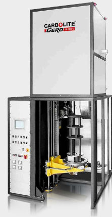
VGLO - függőleges kialakítású GLO kemence