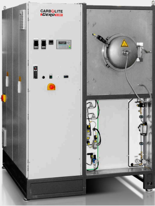
GLO 40/11-1G kemence 1100°C-ig félautomata vezérléssel